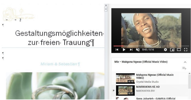
Gestaltungsmöglichkeiten für absolute Afrikaliebhaber: Hier suche ich gerade nach der passenden Musik!